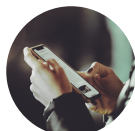
Mato Grosso ...