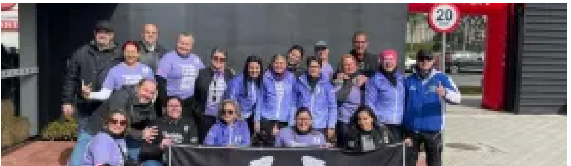
Expedição Filhas do Paraná leva na garupa a bandeira contra a violência à mulher