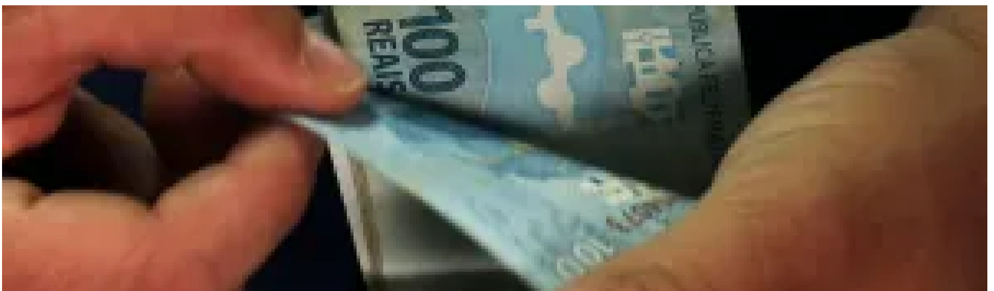
Mais de 10 milhões de pessoas ainda não sacaram fundo do PIS/Pasep