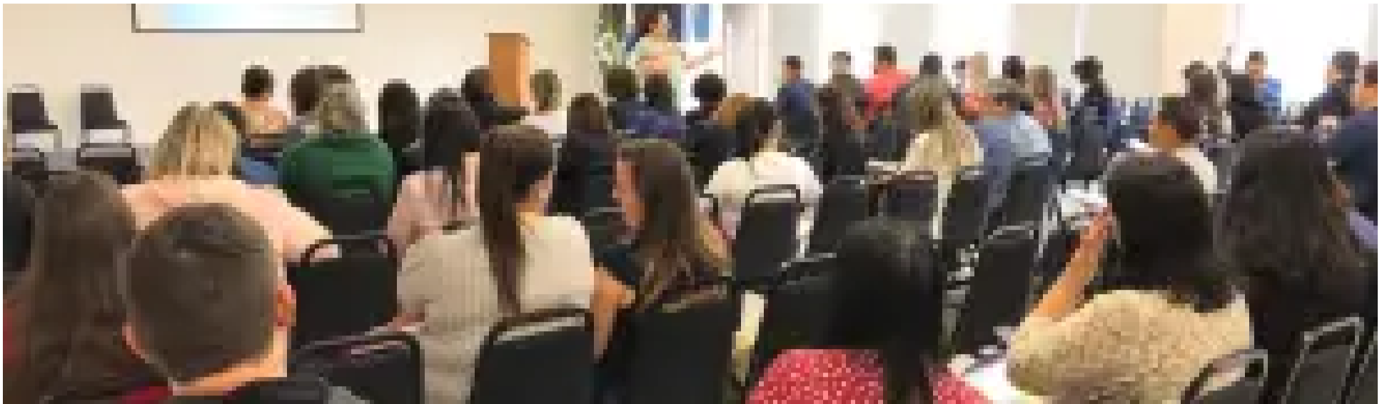
Diretores de escolas recebem orientações sobre prestação de contas ao TCE-PR